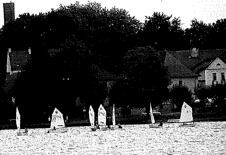
Do groźnego zdarzenia doszło w niedzielę na nowogardzkim jeziorze. Niestety nie dysponujemy zdjęciem ze zdarzenia - zamieszczamy zdjęcie ilustracyjne z archiwum

O tym, że łódka się przewróciła i że potrzebuje pomocy w jej podniesieniu poinformował sam żeglarz (łódka stanowiła jego prywatną własność) dzwoniąc do znajomego, który jest członkiem klubu Knaga i ma dostęp do klubowego pontonu motorowego. Sam żeglarz był w tym czasie bezpieczny, ponieważ posiadał na sobie odpowiedni kapok. Przewróconej łódki nie mógł jednak postawić na wodzie bez pomocy, ponieważ jej maszt wbijał się w dno – w tym miejscu było dość płytko. Na szczycie masztu nie była zamontowana kula wypornościowa, która w takich sytuacjach wywrotki (zdarzają się one relatywnie często w przypadku żaglówek) ma za zadanie zapobiec ustawieniu się łodzi pionowo masztem w dół. Zaalarmowany znajomy żeglarza podpłynął wkrótce pontonem Knagi na miejsce zdarzenia. Straż została zaalarmowana przez nieznaną osobę, która z brzegu zauważyła wywrotkę łódki – nastąpiła ona w wyniku nagłego powiewu (szkwału) wiatru. Gdy strażacy podpłynęli już łodzią przywieziona z Goleniowa i zwodowaną obok plaży, pozostało im w zasadzie asekurowanie akcji ściągnięcia łódki, którą w międzyczasie ustawili już do pionu i usunęli wodę z kadłuba w dwóch feralny żeglarz wraz z przywołanym telefonem kolegą – sternikiem z Knagi.