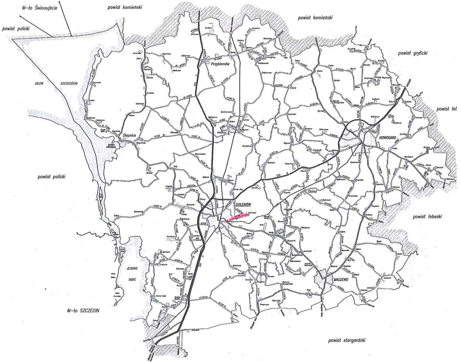
droga powiatowa nr 1182 Goleniów-Mars