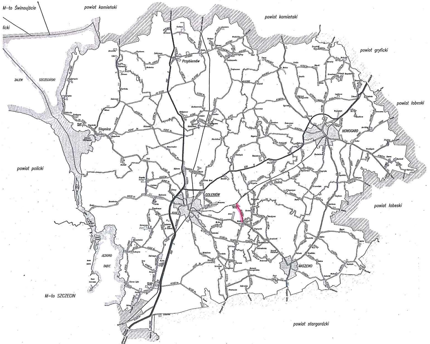
dwaga powiatowa nr 4142Z PKP Mosty - Mosty