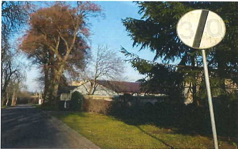
c) Znak pionowy B-34 „30” „koniec ograniczenia prędkości do wymiany.