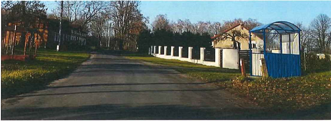
c) Znak pionowy A-1 „niebezpieczny zakręt w prawo” do wymiany.