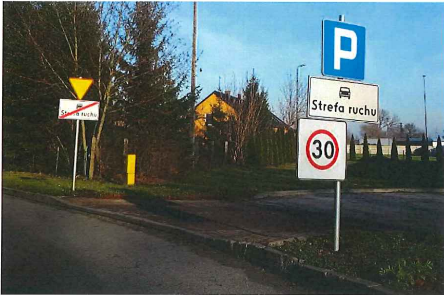
b) Znak pionowy B-34 „30” „koniec ograniczenia prędkości do umycia.