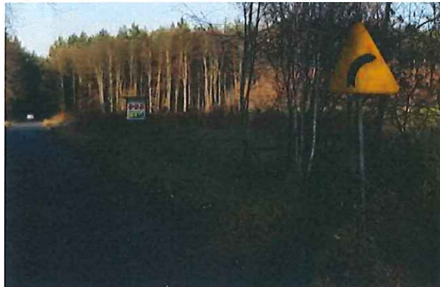
d) Znak pionowy A-1 „niebezpieczny zakręt w prawo” w Maciejewie do wymiany.