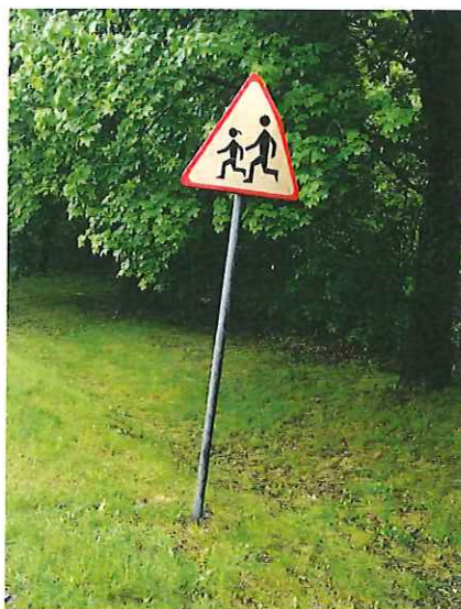
Znak drogowy A-17 „dzieci” do wymiany,