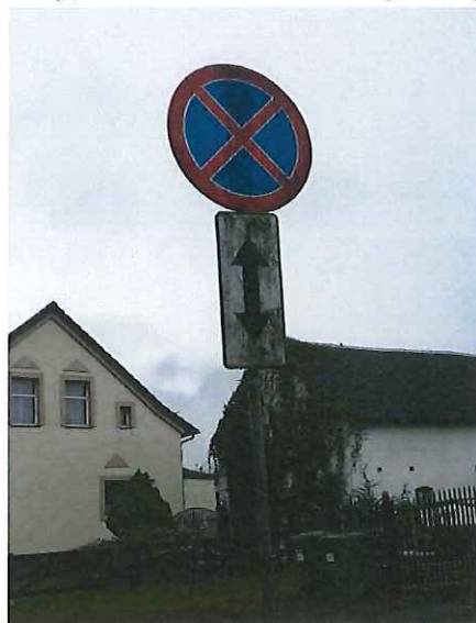
Znak drogowy B-36 (T-25b) „zakaz zatrzymywania się” w m. Miękowo do czyszczenia,