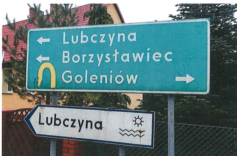
Drogowskaz E-2a do wymiany,