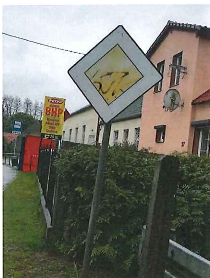
Znak drogowy D-1 „droga z pierwszeństwem” w m. Miękowo do wymiany.