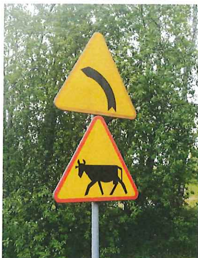
Znak drogowy A-2 „niebezpieczny zakręt w lewo” do wymiany.