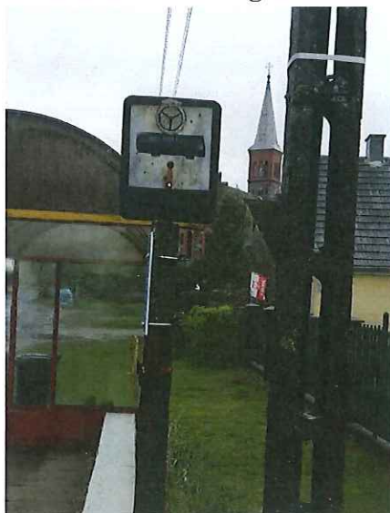
znak drogowy D-15 „przystanek autobusowy” w miejscowości Trzechel do wymiany