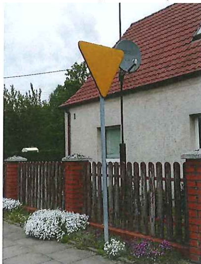
Znak drogowy A-7 „ustęp pierwszeństwa” do wymiany.