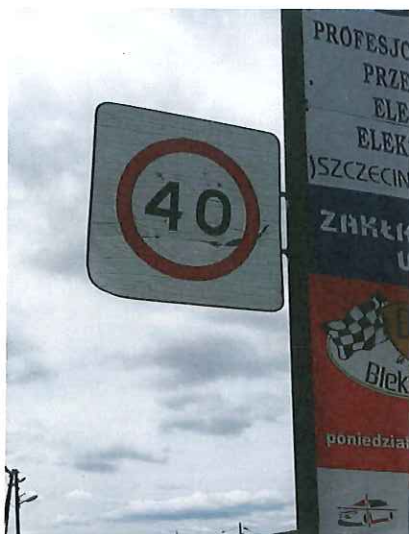
znak drogowy B-43 „strefa ograniczonej prędkości” do wymiany i umieszczenia na prawidłowej konstrukcji wsporczej,