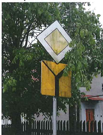
Znak drogowy D-1 (T-6a) „droga z pierwszeństwem” w m. Miękowo brak widoczność tarczy, znak i tabliczka do wymiany,