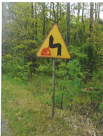
Znak drogowy A-4 „dwa niebezpieczne zakręty - pierwszy w lewo” przed m. Stawno do wymiany.