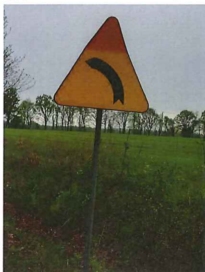
Znak drogowy A-2 „niebezpieczny zakręt w lewo” do wymiany.