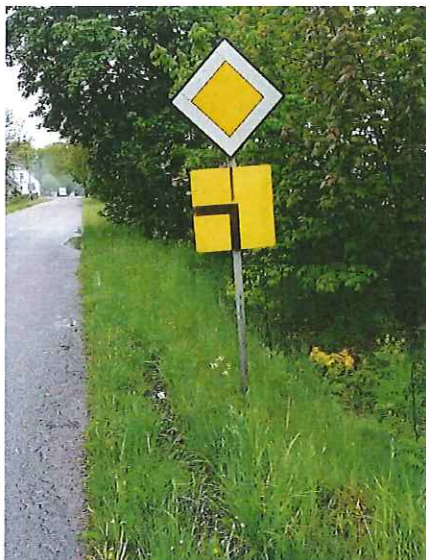
Tablica T-6a w m. Glicko do wymiany,