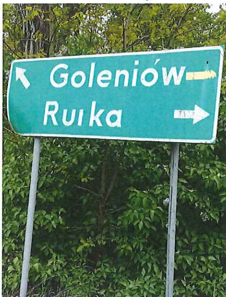
Drogowskaz E-2a do wymiany,