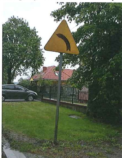
Znak drogowy A-2 „niebezpieczny zakręt w lewo” do wymiany.