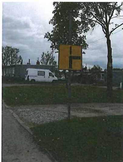
Brak znaku D-1 „droga z pierwszeństwem”.

12. Droga powiatowa nr 4241Z ul. Cmentarna w m. Nowogard: