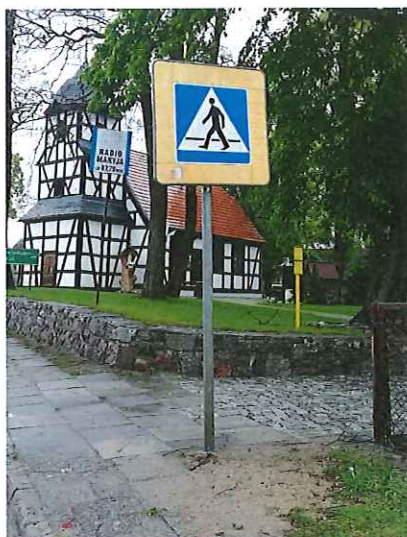
Znak drogowy D-6 „przejście dla pieszych” do wymiany,