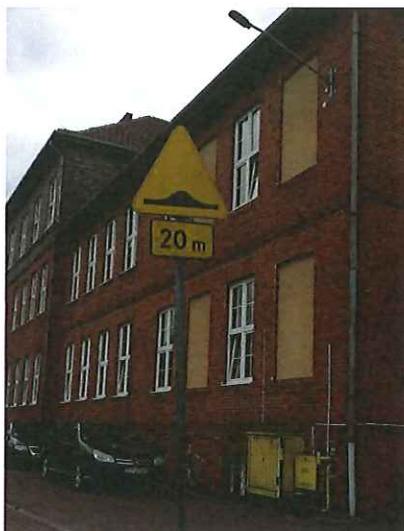
znak drogowy A-11a „próg zwalniający” do wymiany.