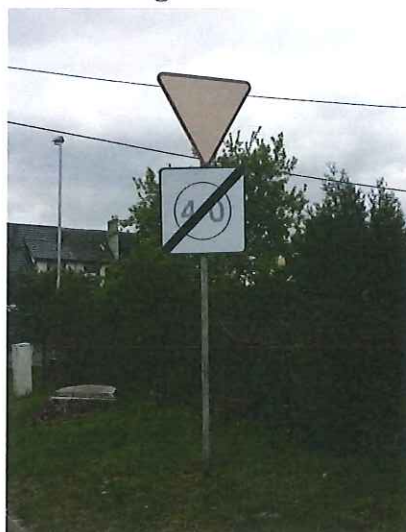
Znak drogowy A-7 „ustęp pierwszeństwa”, -43 „strefa ograniczonej prędkości” do wymiany.