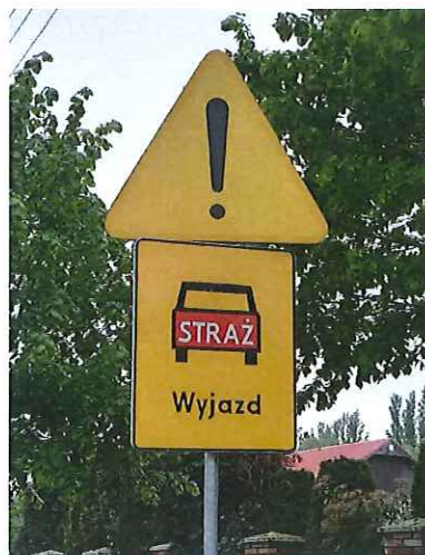
Znak drogowy A-30 „inne niebezpieczeństwo” do wymiany.