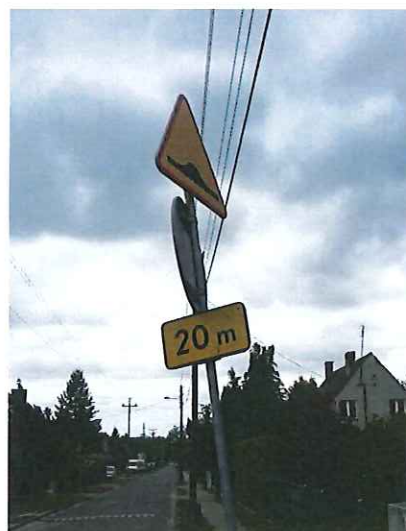
Znak drogowy A-11a „próg zwalniający”, B-33 „ograniczenie prędkości” (T-1) niewłaściwe odchylenie tarczy znaku w stosunku do osi jezdni.