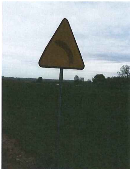
Znak drogowy A-2 „niebezpieczny zakręt w lewo” w . Grabin do wymiany.