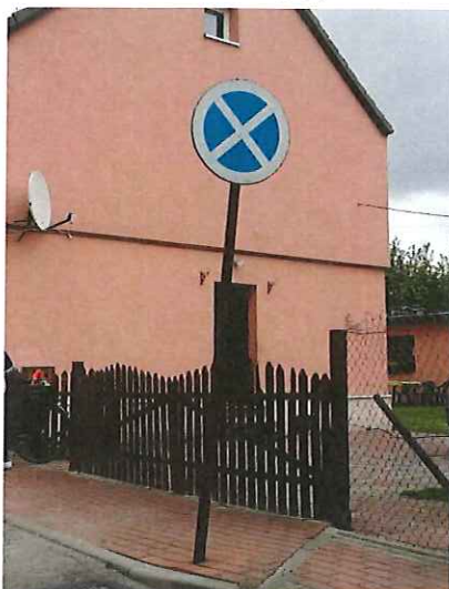
Znak drogowy B-36 „zakaz zatrzymywania się” do wymiany,