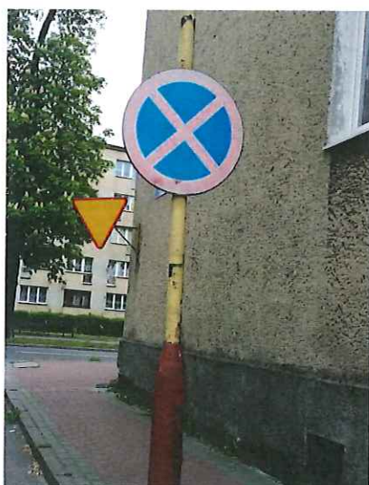
Znak drogowy B-36 „zakaz zatrzymywania się” do wymiany.