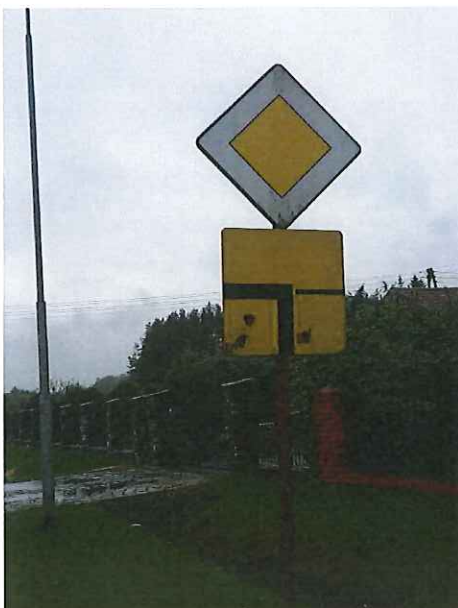
Tablica T-6a w m. Glicko do wymiany.