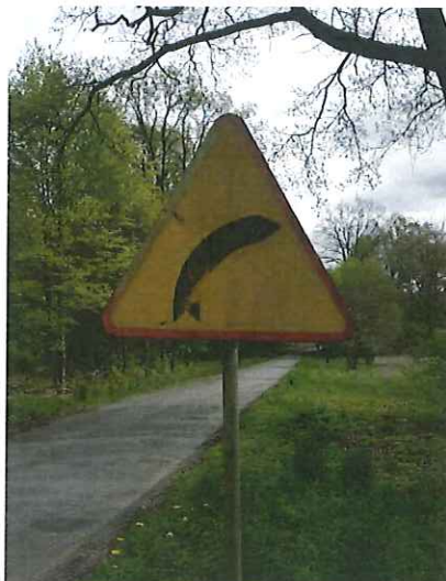
Znak drogowy A-1 „niebezpieczny zakręt w prawo” do wymiany.