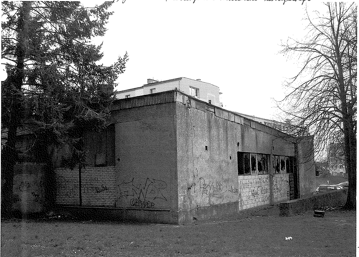
Widok na elewację północną budynku handlowo-usługowego