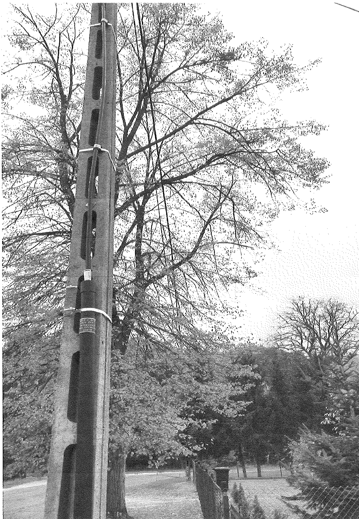
Zdjęcie linii energetycznej w koronie dwóch lip w Bolechowie nr 2